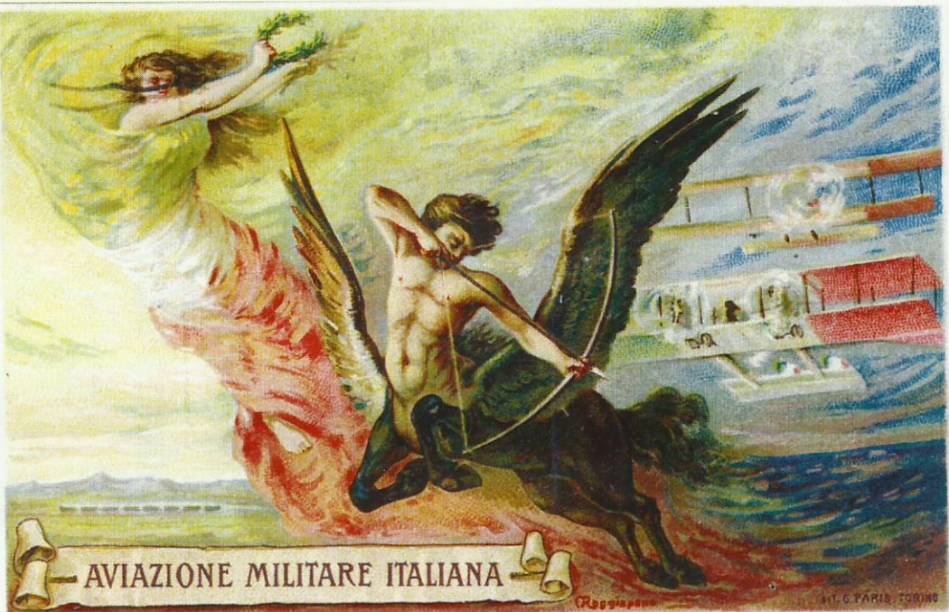
Cartolina militare della 5 a Squadriglia Aeroplani